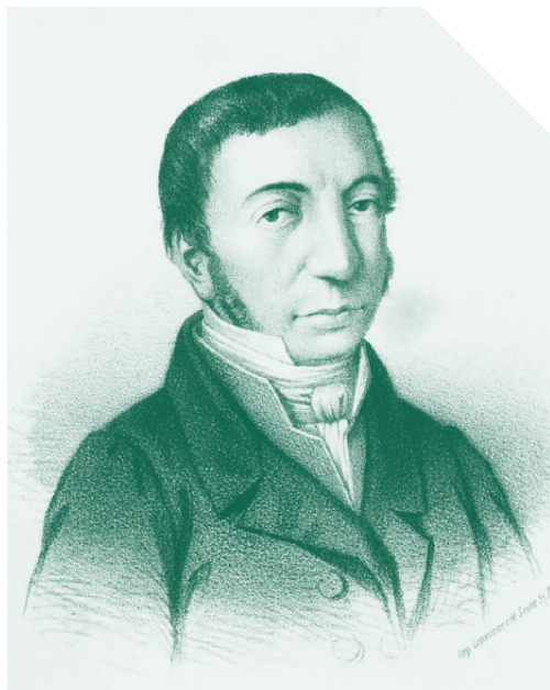
Ὁ διδάσκαλος τοῦ Γένους Κωνσταντῖνος Βαρδαλάχος

στι, στή Χίο, στήν Ὀδυσό καί μετά τήν ἐπανάσταση τοῦ '21 στήν Αἴγινα, ὕστερα ἀπό πρόσκληση τοῦ Καποδίστρια. Στό βιβλίο του «Φυσική Πειραματική», πού ἐκδόθηκε τό 1812, περιλαμβάνει θέματα ἀστρονομίας στά δύο τελευταῖα κεφάλαια καί ἐξετάζεται: Ἡ οὐράνια σφαῖρα, Τό σύστημα τοῦ παντός, Τό ἡλιακό σύστημα, Οἱ κομήτες, Οἱ παλίρροιες κ.λπ.