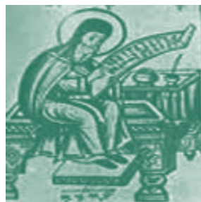
Ὁ Σέργιος Μακραιὸς στό γραφεῖο του

Διδάσκαλος τοῦ Γένους, πού ἀκολούθησε τὴν παλιὰ Ἀριστοτελική μέθοδο καί γι' αὐτὸ ἦταν ἐχθρὸς τοῦ ἡλιοκεντρικοῦ συστήματος. Ἐγραψε τὸ «Τρόπαιον ἐκ τῆς ἑλλαδικῆς πανοπλίας κατὰ τῶν ὁπαδῶν τοῦ Κοπερνίκου ἐν τρισὶ διαλόγοις» (Βιέννη 1797) ὅπου ἐπιχειρεῖ ἀφελή ἀναίρεση τοῦ ἡλιοκεντρικοῦ συστήματος. Τὸ βιβλίο του αὐτὸ εἶναι μιά κακόβουλη ἐπίθεση στὸ βιβλίο τοῦ Φοντενέλ 1 .