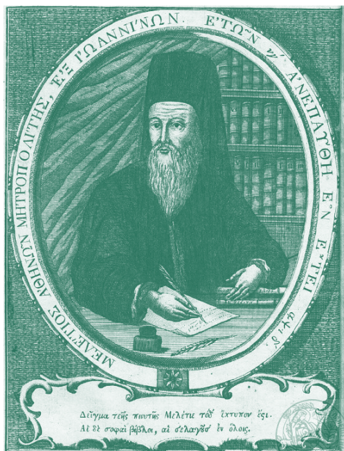
Ο επίσκοπος Άθηνών Μελέτιος

Κληρικός, παιδαγωγός και μαθηματικός, διαπρεπής εισηγητής του νεοελληνικού διαφωτισμού. Είναι ο πρώτος που αντικατέστησε την αρχαϊζουσα, ως γλώσσα διδασκαλίας, με τη δημώδη και από τους πρώτους που δίδαξε νεότερα μαθηματικά. Τό 1749 εκδίδει τό βιβλίο του «Οδός Μαθηματική» που περιλαμβάνει γεωμετρία, εικονομετρία, άστρονομία, τριγωνομετρία, άλγεβρα και φυσικές επιστήμες. Είναι τό πρώτο ελληνικό και μάλιστα ολοκληρωμένο μαθηματικό έγχειρίδιο τής νεότερης ιστο-