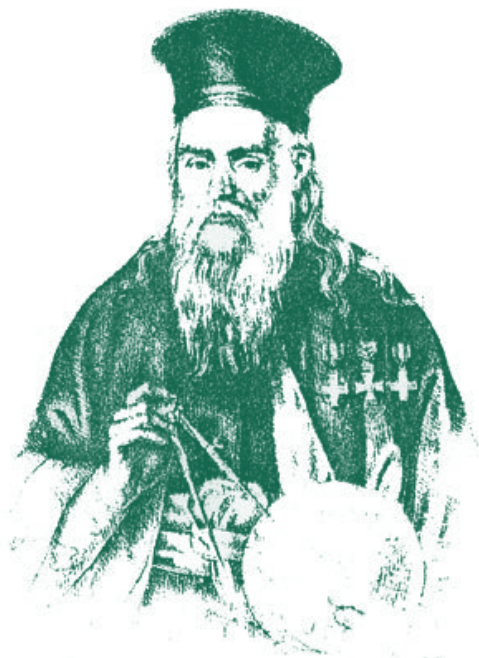
Ὁ ἀρχιμανδρίτης Διονύσιος Πύρρος ὁ Θεσσαλός

ροῦνται τὰ συστήματα τοῦ κόσμου καί ιδιαίτερα τὸ Κοπερνίκειο Σύστημα, τὸ ὁποῖο υἱοθετεῖ, ἢ παράλλαξη καί πολλή οὐρανογραφία, μέ καταχώρηση 3.443 ἀστέρων.