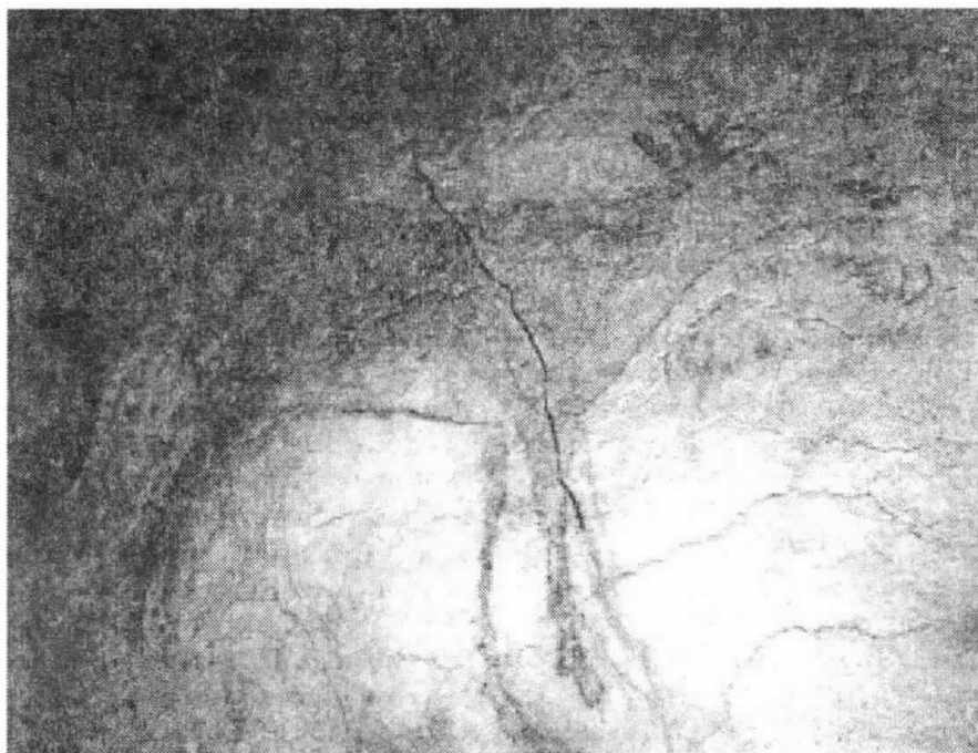
Εἰκ. 2 & 3. Σπήλαιο Altamira: Μικροὶ βίανες, ζωγραφισμένοι στὸν τοῖχο μὲ χρώματα ὅπου κυριαρχεῖ τὸ καφέ-κόκκινο. (Παλαιολιθικὴ ἐποχὴ, περίπου 15.000 χρόνια πρὶν). Ἐκτὸ τοῦ ἴδιου βιβλίου ὅπως καὶ ἡ Εἰκ. 1.

Ἐκτὸς θεολογικῆς πλευρᾶς, ἴσως νὰ ἔχει κάποια ἀξία ἡ διατύπωση ὅτι, ἡ ἐμφάνιση