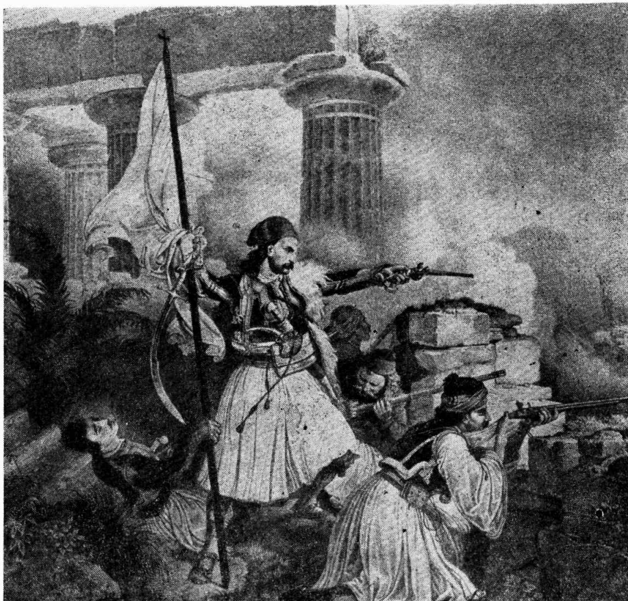
Μάχη τῆς Κορίνθου ἐσχεδίασε Κ. Κραζαϊσεν.