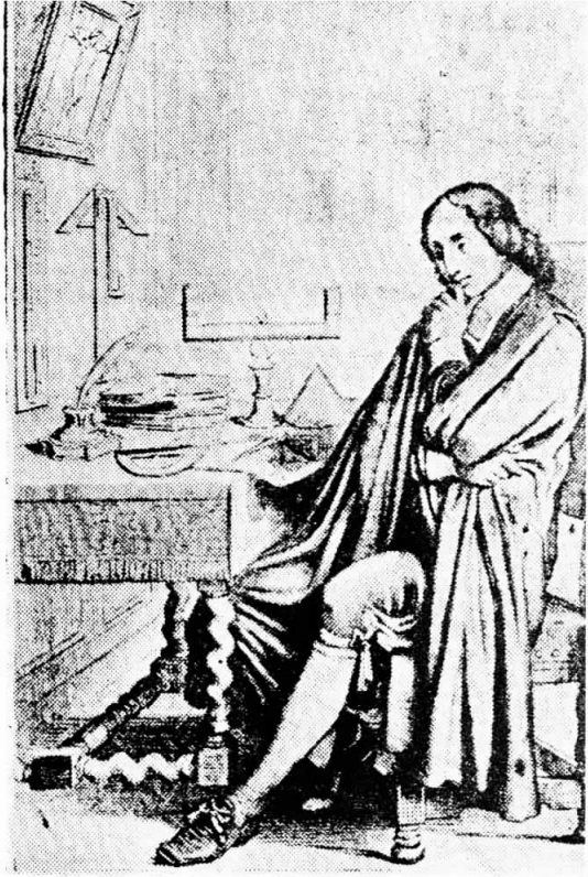
Ὁ Πασκάλ στο δωμάτιο τῆς ἐργασίας του.

Μπροστά στο μυστήριο τοῦ Σταυροῦ καί τοῦ ἀν- θρώπου.