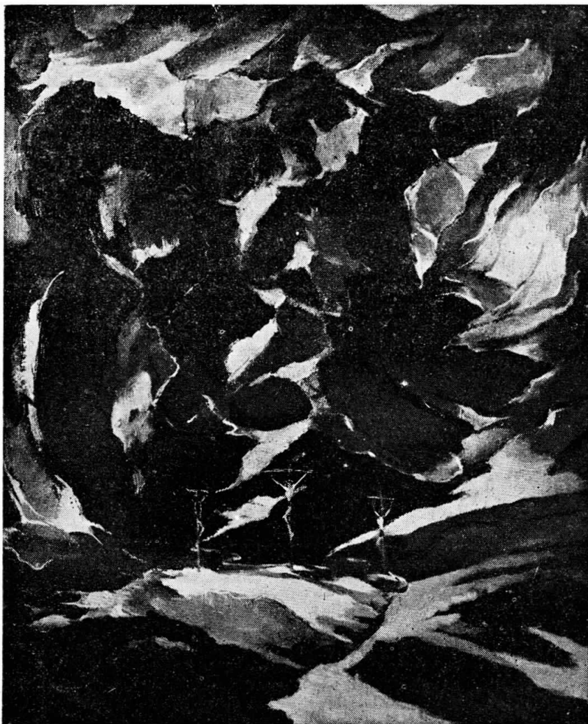
Δ. Πουλιανοῦ: Ἡ ΣΤΑΥΦΩΣΙΣ.,

ῶπως μὲ ἰδιαίτερη χαρὰ μαθαίνουμε, ἡ ἐργασία αὐτὴ, καμωμένη μὲ μεγάλη καλλιτεχνικὴ ἱκανότητα, ἀλλὰ καὶ μ' ἐνθουσιασμὸ καὶ μὲ πίστη, ζωντανεῖ, μὲ τὸν πρὸ παραστατικὸ τρόπο καὶ μὲ βαθὺ σεβασμὸ πρὸς τὰ σεπτὰ πρό-