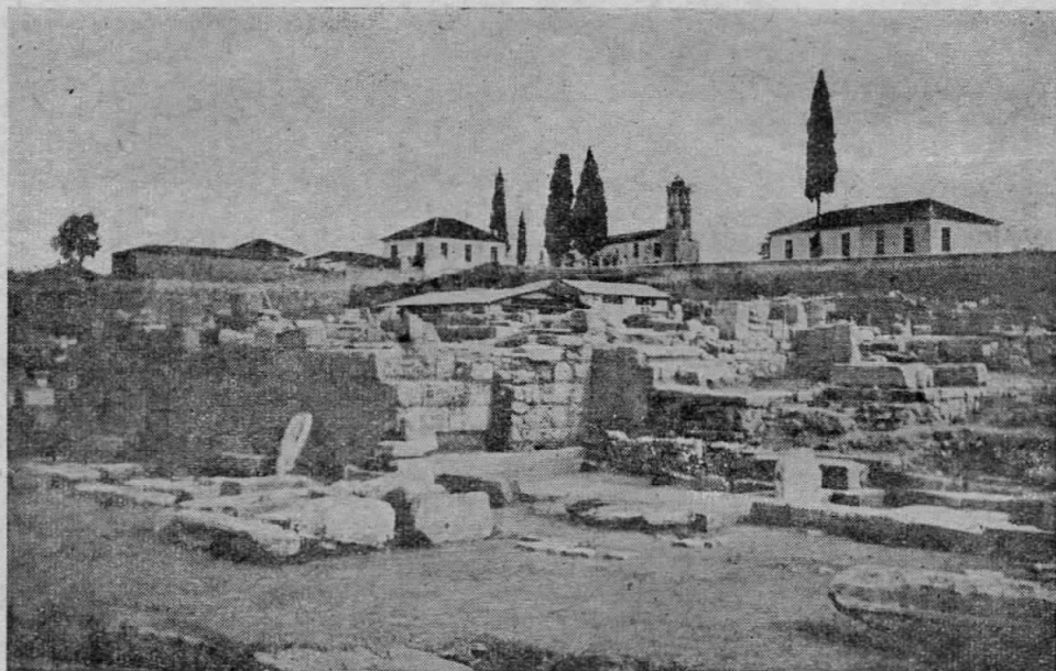
Βορειοδυτικὴ ἄποψις τῶν ἐρειπίων τοῦ Βήματος εἰς τὴν ἀγορὰν τῆς Κορίνθου μὲ τὸ δυτικὸν «δωμάτιον ἀναμονῆς» καὶ ὀπίσω τὰ ἐρεῖπια τῆς «πολιτικῆς ἀγορᾶς». Ἡ νοτιὰ εἴσοδος καὶ ὁδὸς τῆς ἀγορᾶς εἶναι δεξιὰ τῆς φωτογραφίας.

ποθέσωμεν, ὅτι ἡ ἐπιγραφή τῆς συναγωγῆς πού εὑρέθη εἰς τὸ κάτω ἄκρον τῆς κλίμακος, ἡ ὁποία ὠδήγει τὸν ἐπισκέπτην ἀπὸ τὰ Προπύλαια εἰς τὴν ἀγορὰν, δεικνύει ὅτι ἡ παλαιὰ συναγωγή δὲν ἀπεῖχε —πράγμα τὸ ὁποῖον καμμία λεπτομέρεια δὲν ἔρχεται νὰ ἐπιβεβαιώσῃ—ὁ δρόμος τοῦ Λεχαιοῦ πρέπει νὰ ἦτο ὁ δρόμος πού θὰ προετίμα νὰ διασχίξῃ ὁ ἱεροκέρυξ, ὅταν ἐπήγαιεν εἰς τὴν συναγωγὴν καὶ ἐσύχναζεν εἰς τὸ σπῆτι τοῦ Τίτου Ἰούστου, πού ἦτο πλησίον πρὸς αὐτήν.