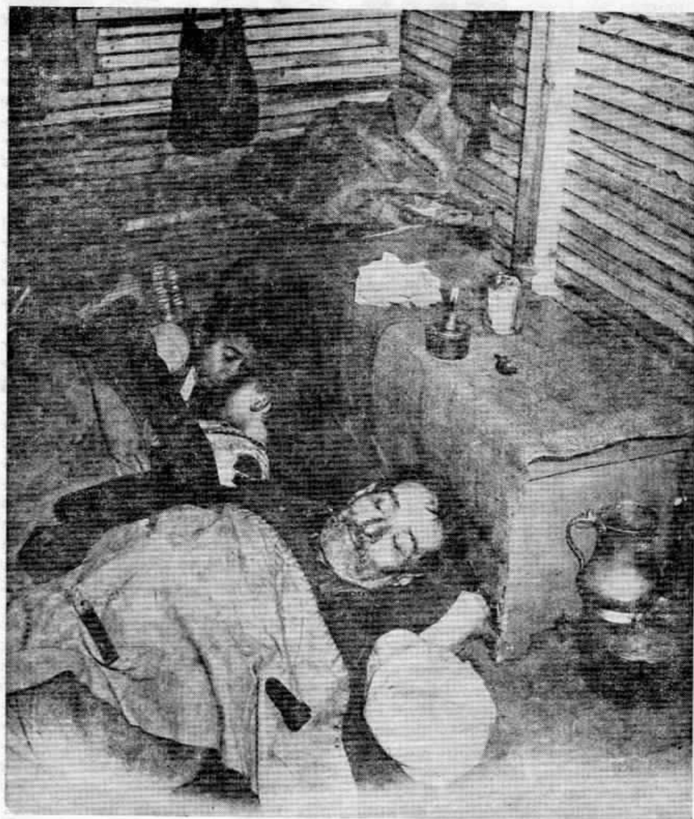
*Ωρα ύπνου στον καταυλισμό «Αναγέννησις» (Ιωάννινα). Ο γέροντας και τὰ παιδιά κοιμούνται τώρα ησυχά σὲ μιὰ γωνιά τῆς παράγγας. Ἡ φωτογραφία δὲν δείχνει καὶ τίς ἄλλες γωνίες πού ἔνδεκα ἄλλα ἄτομα κοιτῶνται σ' αὐτές. Οἱ δεκατέσσερις ἔνοικοι τοῦ ἑνὸς δωματίου ἀνήκουνσὲ δυὸ οἰκογένειες ἀπὸ τὸ Μακρόπουλο καὶ τὰ Ζαβρόσια Πωγωνίου.