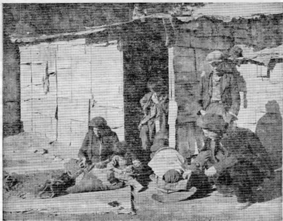
Μιά συνηθισμένη εικόνα της νέας μας προσφυγιάς. Και σκέπτεται κανείς, πώς θα αντιμετώπισουν τον χειμώνα οι συμμοριόπληκτοι στην προχειρότατη τούτη παράγυα, την κατασκευασμένη από τενεκέδες και κουτιά.

Στο Καρπενήσι, ένας τρελλός συμπαθητικός γέροντας, περιφέρει κι' αυτός μιὰ φωτογραφία με τα έπτά παιδιά του. Κανένα απ' αυτά δεν ξέρει αν ζήη και πώς ζήη. Και έχει την επιθυμία νά δήη την φωτογραφία