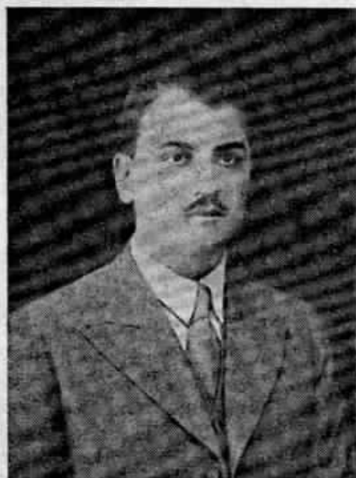
† ΑΛΕΞΑΝΔΡΟΣ Ι. ΓΚΙΑΛΑΣ (1915-7 ΜΑΪΟΥ 1948)

Μ' αὐτὴν τὴν ἐλπιδοφόρα ὕμνωδια ἐσίγησε ὁ ποιητής. Ὁ ποιητής Γ. Βερίτης καὶ οἱ ἡρωϊκοὶ του στίχοι, οἱ στίχοι μὲ τὸν πηγαῖο χριστιανικὸ λυρισμὸ, ποῦ ἀγαπήθηκαν ἀπὸ τὰ ἑλληνικὰ χριστιανικὰ νειῶτα. Ἀκριβῶς τὰ ἑλληνικὰ νειῶτα ἔχουν στὸ στόμα πρόχειρους τοὺς στίχους τοῦ Βερίτη, ἀκόμα καὶ σὰν χριστιανικὸ τραγουδι. Μελοποιημένα ἀπὸ τὴν Δίθα Ἑλένη Οἰκονομοπούλου μερικὰ ἀπὸ τὰ ἐκλεκτότερα ποι-