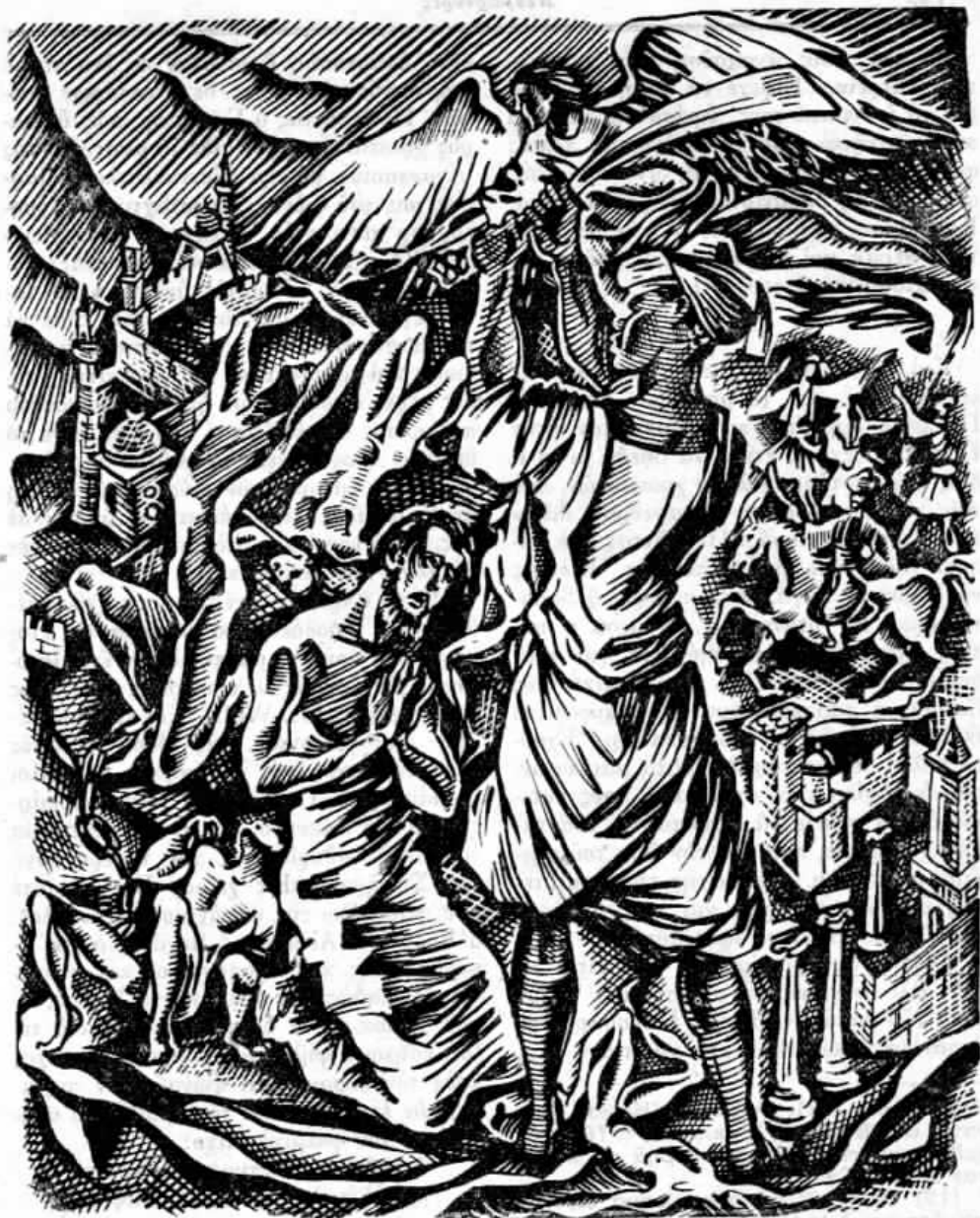
ΣΧΕΔΙΑΣΜΑ ΣΤ. ΟΡΦΑΝΙΔΗ

«Μάρτυρες και ὁμολογηταὶ τῆς Χριστιανικῆς πίστεως λαμπρύνουν μὲ τὸ αἷμά των τὴν ἱστορίαν τῆς Χριστιανικῆς Ἐκκλησίας καὶ προσφέρουν ἑαυτοὺς σφάγια τίμια καὶ ἱερά διὰ τὴν ἀγάπην Ἐκείνου, ὅστις ἔτερμάτισε τὴν ἐπίγειον σταδιοδρομίαν Του ὡς κατάδικος ἐπὶ τοῦ Σταυροῦ».