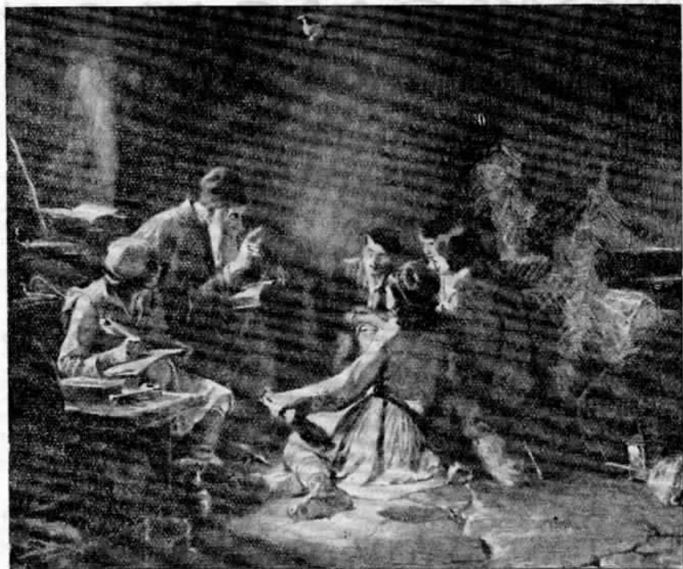
ΑΠΟ ΤΟ ΕΡΓΟΝ ΤΟΥ Ν. ΓΥΖΗ

«Ακούγοντας και ἐγώ, ἀδελφοί μου, τοῦτον τὸν γλυκύτατον λόγον, ὅπου λέγει ὁ Χριστός μας νὰ φροντίζωμεν καὶ διὰ τοὺς ἀδελφούς μας, μέτρωγεν ἐκεῖνος ὁ λόγος μέσα εἰς τὴν καρδιά τῶσους χρόνους, ὡσάν τὸ σκουληκι, ὅπου τρώγει τὸ ξύλον, τί νὰ κάμω καὶ ἐγώ... Ὁθεν ἄφησα τὴν ἐδικὴν μου προκοπὴν, τὸ ἐδικόν μου καλὸν καὶ ἐβγήκα νὰ περιπατῶ ἀπὸ τόπον εἰς τόπον, νὰ διδάσκω τοὺς ἀδελφούς μου... Ἀκούγοντας καὶ ἐγώ αὐτὸν τὸν γλυκύτατον λόγον ὅπου λέγει ὁ Χριστός μας, χάρισμα νὰ δουλεύωμεν τοὺς ἀδελφούς μας, εἰς τὴν ἀρχὴν μοῦ ἐφάνη βαρὺς ὁ λόγος. Ὑστερα ὁμως μοῦ ἐφάνη γλυκύτατος, καθὼς μέλι καὶ κηρίον καὶ ἐδόξασα τὸν Θεὸν καὶ δοξάζω χιλιάδαις φοραῖς ὅπου μὲ τὴν χάριν τοῦ Κυρίου μας Χριστοῦ τοῦ Ἐσταυρωμένου καὶ Θεοῦ δὲν ἔχω οὔτε σακκοῦλα, μήτε σπίτι, μήτε κασέλλα, μήτε ἄλλο ράσο ἀπ' αὐτὸ ὅπου φορῶ, ἀλλὰ ἀκόμη παρακαλῶ τὸν Κύριόν μου, μέχρι τέλους τῆς ζωῆς μου νὰ μὲ ἀξιώσῃ νὰ μὴν ἀποκτήσω τίποτε.....».