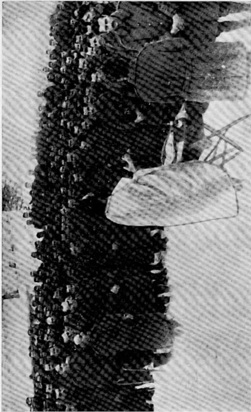
ΛΑΤΡΕΙΑ ΕΙΣ ΤΟ ΜΕΤΩΝ