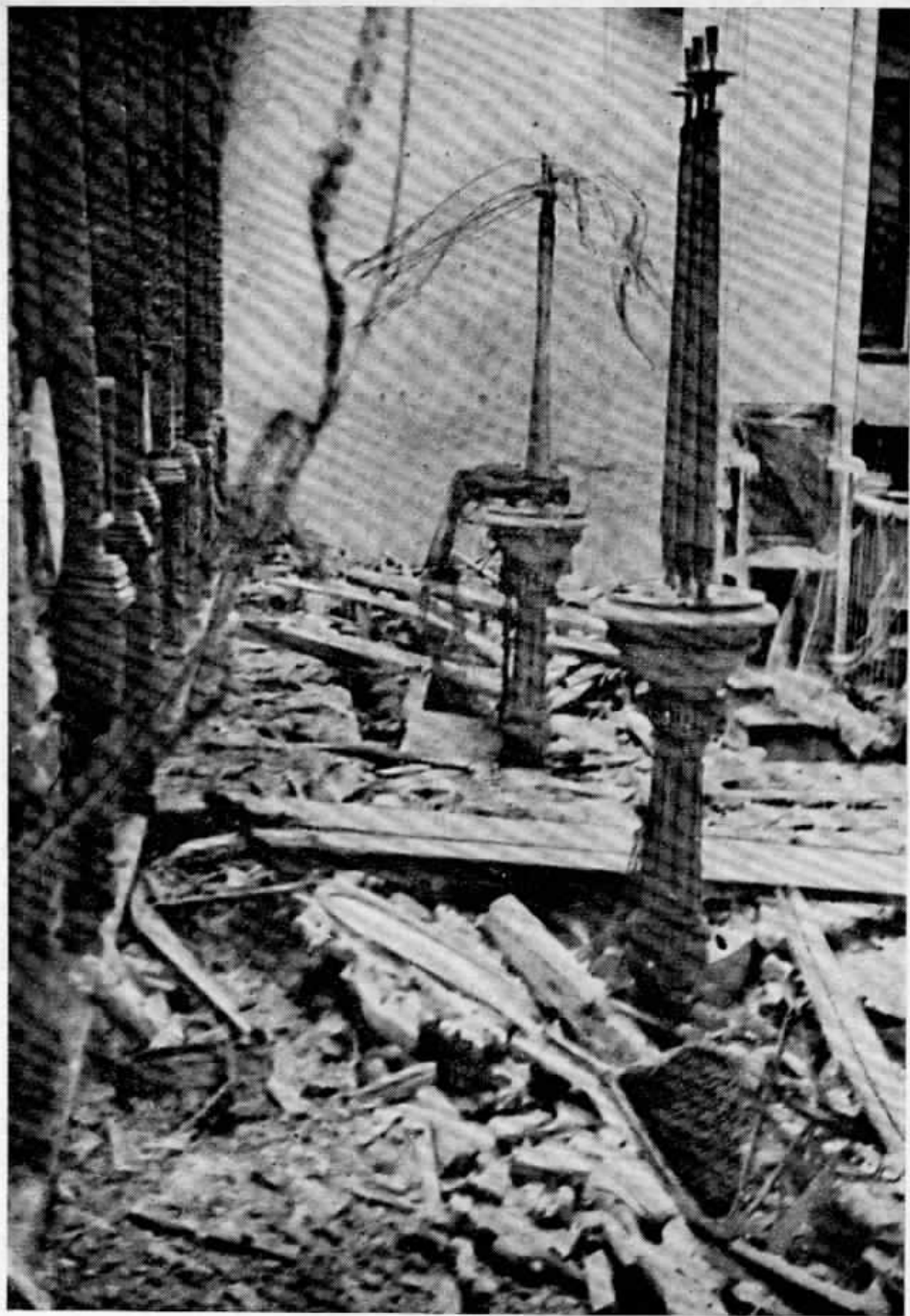
ΕΚΚΛΗΣΙΑ ΒΟΜΒΑΡΔΙΣΘΕΙΣΑ ΑΠΟ ΤΟΥΣ ΙΤΑΛΟΥΣ