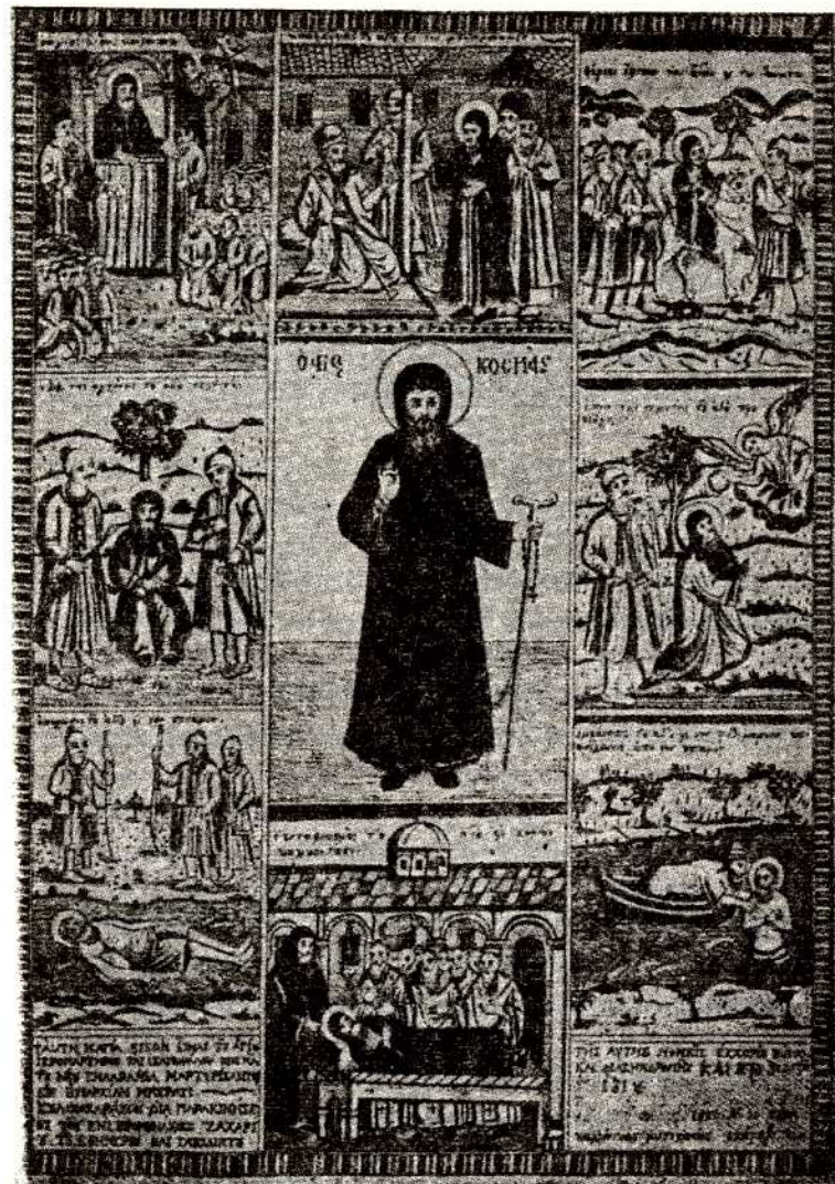
Κοσμᾶς ὁ Αἰτωλός

Κι ὅλα τοῦτα ὡς τὴν ὥρα ποὺ τὸν συνέλαβαν, τὸν ἔριξαν στὴ φυλακὴ καὶ σὲ λίγο τὸν τράβηξαν στὴ θέση Μπουγιαλῆ, κοντὰ στὸν ποταμὸ Ἄψο, στὴ Βόρεια Ἥπειρο. Τὸ τέρμα τοῦ μαρτυρικοῦ του Γολγοθᾶ μᾶς τὸ περιγράφει μιὰ χειρόγραφη σημείωση, ποὺ φαίνεται πὼς γράφτηκε ἀπὸ αὐτόπτη. Λέει: «Οἱ δήμοι τὸν ἐκάθησαν κοντὰ εἰς ἕνα δένδρον καὶ ἠθέλησαν νὰ τοῦ δέσουν τὰ χέρια, ἀλλ' ἐκεῖνος δὲν τοὺς ἄφησε, λέγοντάς τους ὅτι δὲν ἀντιστέκεται. Ἐπειτα ἀκούμπησε τὴν ἱερὰν κεφαλὴν του εἰς