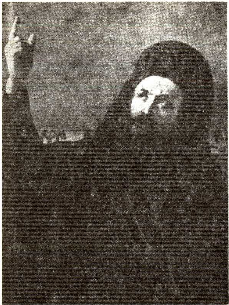
Πατριάρχης Γρηγόριος ὁ Ε΄