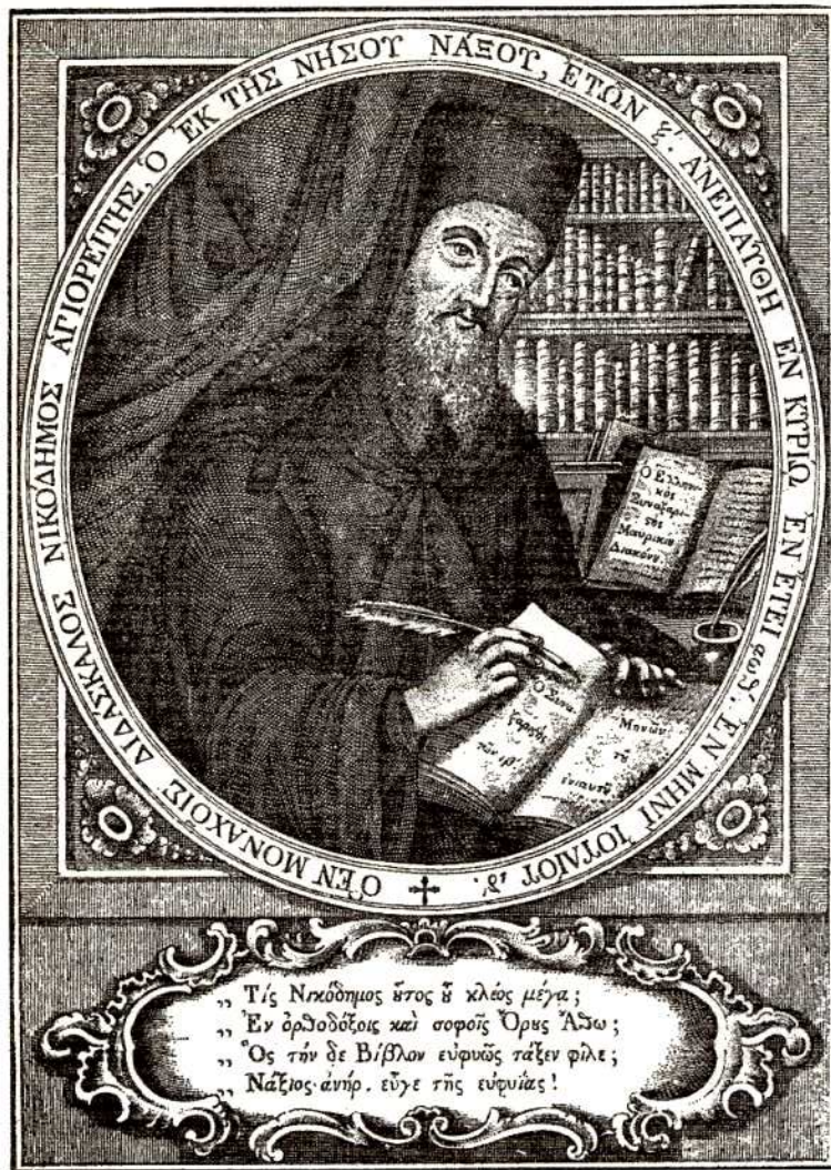
Νικόδημος ὁ Ἀγιορείτης.

ὁ Νικόδημος εἶχε ἐξυπνάδα καὶ μνήμη. Ἦταν κάτοχος τῆς λατινικῆς, ἰταλικῆς καὶ γαλλικῆς γλώσσας.