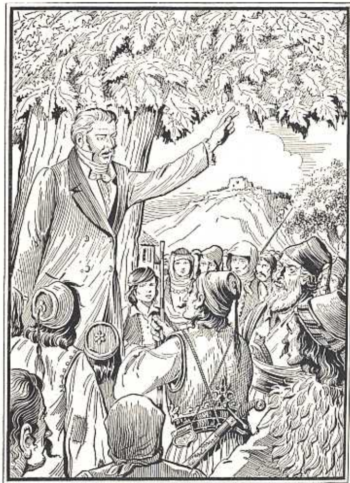
ἽΟ Γεώργιος Γεννάδιος τονώνει τοὺς μαχητάς.

Μετὰ τὴν ἐνδοξὴ καὶ ἥρωϊκὴ πτώσι τοῦ Μεσολογγίου ὁ ἀγὼν φαινόταν ὅτι ἐσβῆνε. Σχεδὸν ὁλό-