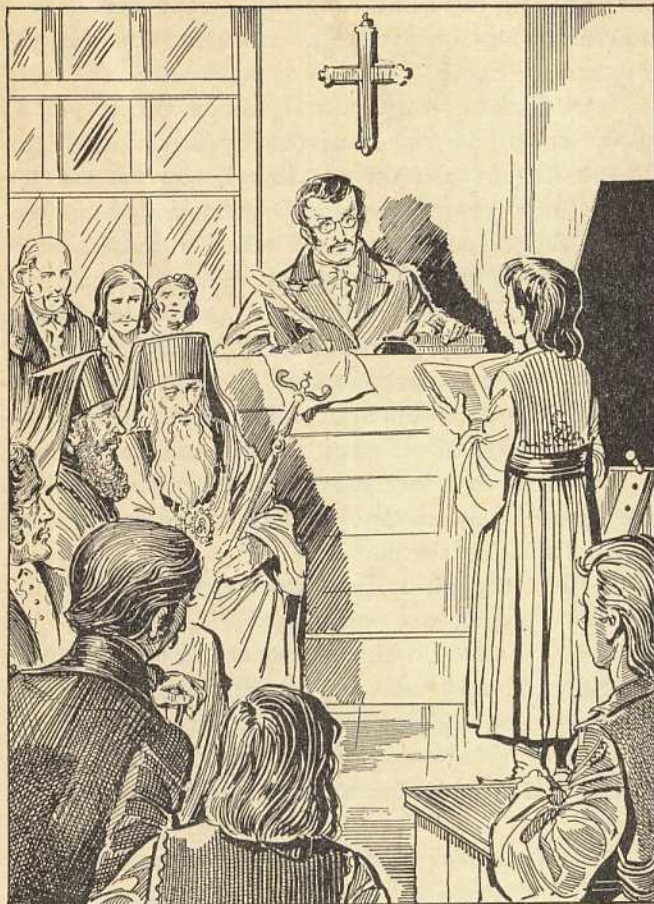
Ὁ Πατριάρχης Κύριλλος στ' ἐστὴν Σχολὴν τοῦ Γένους

Ἦταν ἡμέρα ἐξετάσεων. Ἡμέρα γιορτῆς γιὰ τὴν Σχολήν. Οἱ καθηγηταὶ εἶχαν ἐργασθῆ ὅλο τὸ χρόνο. Οἱ μαθηταὶ εἶχαν μελετήσῃ ὅσο μπορούσαν καλύτερα μὲ τὴν εὐγενική φιλοδοξία νὰ πάρουν καλοὺς βαθμούς. Ἡ ὥρα τῶν ἐξετάσεων πλησίαζε. Κόσμος πολὺς ἦταν συγκεντρωμένος στὴ μεγάλη αἴθουσα τῆς Σχολῆς καὶ περίμεναν τὸν Ἐθνάρχη. Ἕνας ξεχωριστὸς θρόνος ἦταν στημένος γιὰ τὸν Κύριλλο. Σὲ λίγο ὁ Πατριάρχης ἀργά-ἀργά μπῆκε στὴν αἴθουσα. Δὲν κάθησε στὸ θρόνο. Πῆρε μιὰ καρέκλα καὶ κάθησε δίπλα στὴν ἔδρα τοῦ δασκάλου. Σταύρωσε τὰ χέρια του καὶ τὸ μάτι του καρφωνόταν ἄλλοτε πάνω στὴν ἔδρα καὶ ἄλλοτε στοὺς νεαροὺς σπουδαστάς,