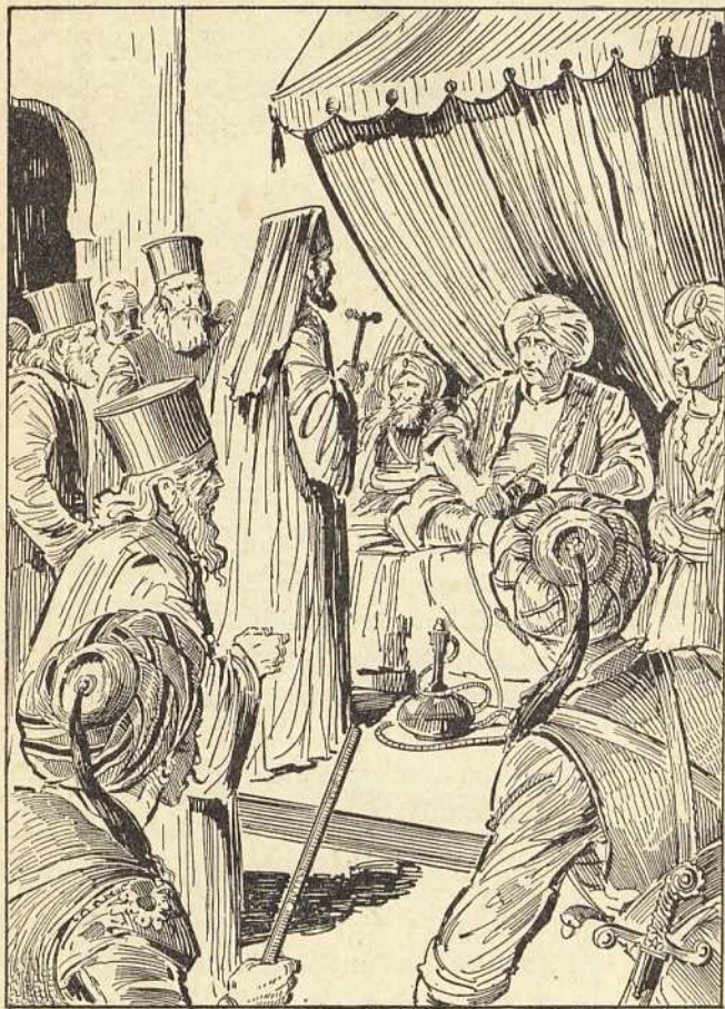
Ὁ Ἐθνάρχης Κυπριανὸς μπρὸς στὸν Πασᾶ

Αὐτὰ τὰ λόγια εἶπε ὁ αἰμοβόρος Μεχμέτ γιὰ νὰ τρομάξῃ τὸν Κυπριανό. Τὸ χατζάρι τοῦ ἔδειξε γιὰ νὰ δειλιάσῃ τὸ παλληκάρι. Τὸ ξεπάστρεμα τῆς Ρωμhosύνης τοῦ προμήνυσε γιὰ νὰ τὸν κάνῃ νὰ προδώσῃ τὴν πίστι του καὶ τὸ Ἔθνος του. Ἄλλ' ὁ Ἐθνάρχης δὲν ἦταν ἀπὸ τοὺς ἀνθρώπους, πού εὐκολὰ κάμπτονται. Ἦταν ὁ Ἠγέτης ἑνὸς ἀκατάβλητου λα-